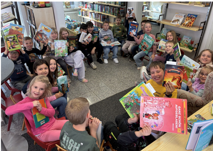
Klasse 1/2a der Grundschule Kellmünz

In der anschließenden Kinderkonferenz würde das nächste Ereignis besprochen – der Vorlesewettbewerb nach Pfingsten in der Schule.