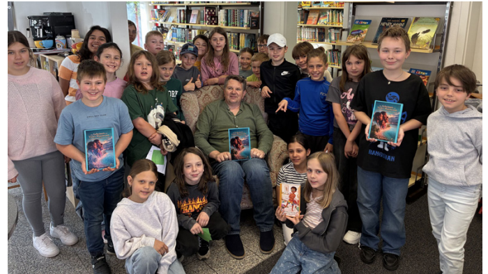
Klasse 3 und 4 der Grundschule Kellmünz

Eine Autorenlesung für Kinder gab es davor noch nie, es eröffnet eine Chance, Kindern einen erweiterten Blick auf Literatur zu ermöglichen, sodass das gesamte System Literatur in den Blick gerät.