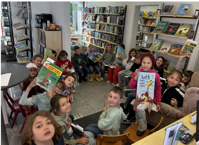
Klasse 1/2b der Grundschule Kellmünz