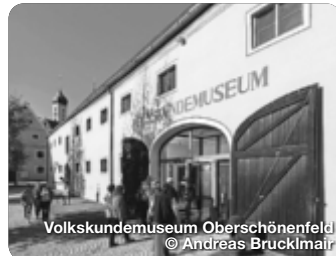
Volkskundemuseum Oberschönenfeld