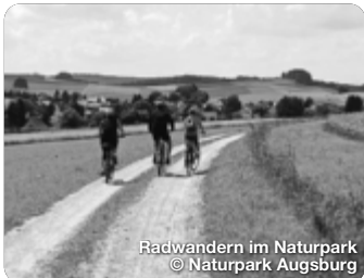
Radwandern im Naturpark

TreffpunktDeutschland.de/augsburger-land