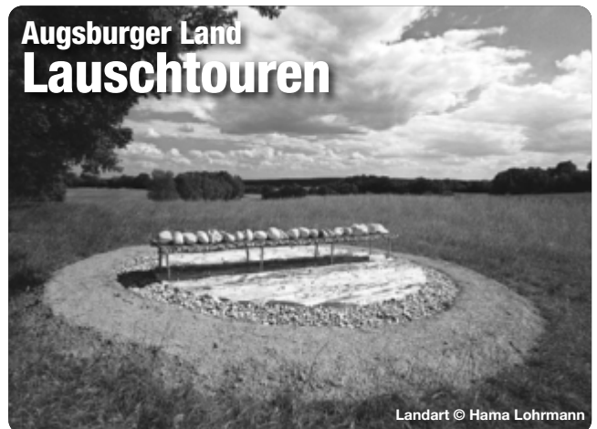
Landart © Hama Lohrmann

Mit dem Audioguide auf den Spuren großer Persönlichkeiten wandern und dabei spannende Erlebnisse und unterhaltsame Geschichten hören. Alles was Sie dafür benötigen ist die kostenlose Bayerisch-Schwaben-Lauschtour App. Mit dem GPS werden die Lauschpunkte automatisch abgespielt – gehen Sie die Tour also in Ihrem eigenen Tempo. Unser Tipp: Die Touren funktionieren auch offline. Am besten lädt man die Tour bereits zu Hause im WLAN herunter.