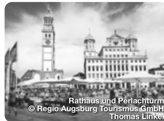
Rathaus und Perlachturm